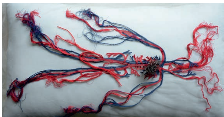
Pénétration , 1997, Annette Messager