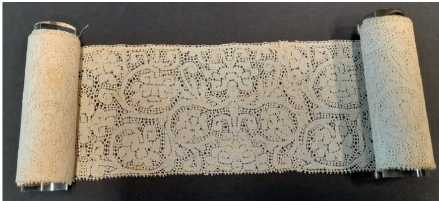
Bande de dentelle, 1600-1700

Malgré sa complexité, sa lenteur de réalisation, et donc un coût élevé, la dentelle est un incontournable de la garde-robe de prestige du 16 e au 18 e siècle. À l'époque de Vermeer, elle est principalement employée pour les cols, l'extrémité des manches ou les mouchoirs. Assemblage de motifs ornementaux, elle suit les modes et entraîne la publication de patrons.