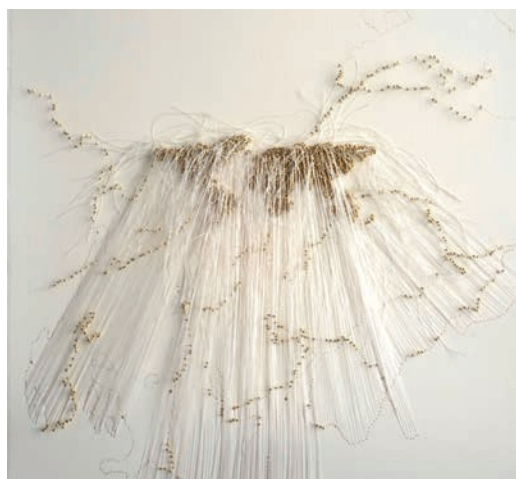
Rutas , Safâa Erruas, 2021