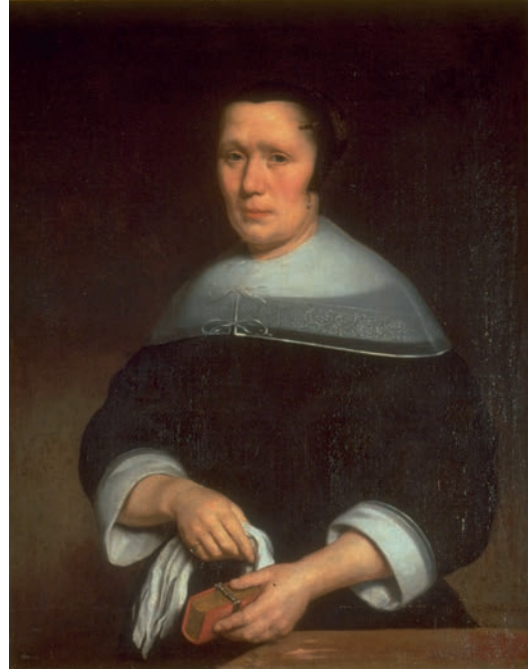
Portrait de femme , Nicolas Maes, 1667 © Musée des Beaux-Arts d'Arras

Les fuseaux sont des bobines de bois que La Dentellière saisit entre ses doigts. La dentelle s'exécute sur un petit métier appelé carreau, sur lequel un parchemin dessiné est épinglé. Le dessin indique la position des épingles et détermine le motif à reproduire. Les fuseaux servent à manier les fils sans les emmêler ni les salir. Un tiroir placé sous le plan de travail protège l'ouvrage au fur et à mesure qu'il est réalisé. Les fils sont généralement constitués de lin, une plante dont la culture est fortement développée dans les Provinces-Unies (Pays-Bas actuels).