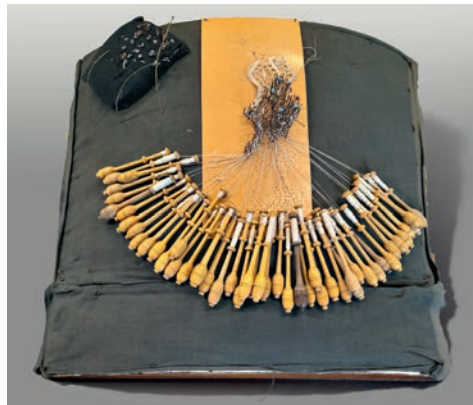
Carreau de type flamand, 1850-1950