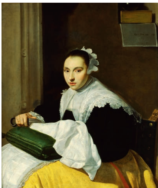
La Couturière, anonyme, 1633